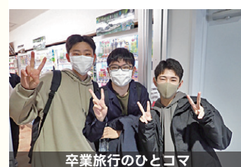
卒業旅行のひとコマ

スクリーンに映し出される懐かしい姿に、少し照れくさそうな表情を浮かべながらも、仲間や先生方と過ごした時間を懐かしむ、心温まるひとときを過ごしました。