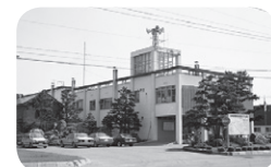
▲役場庁舎(昭和62年撮影)