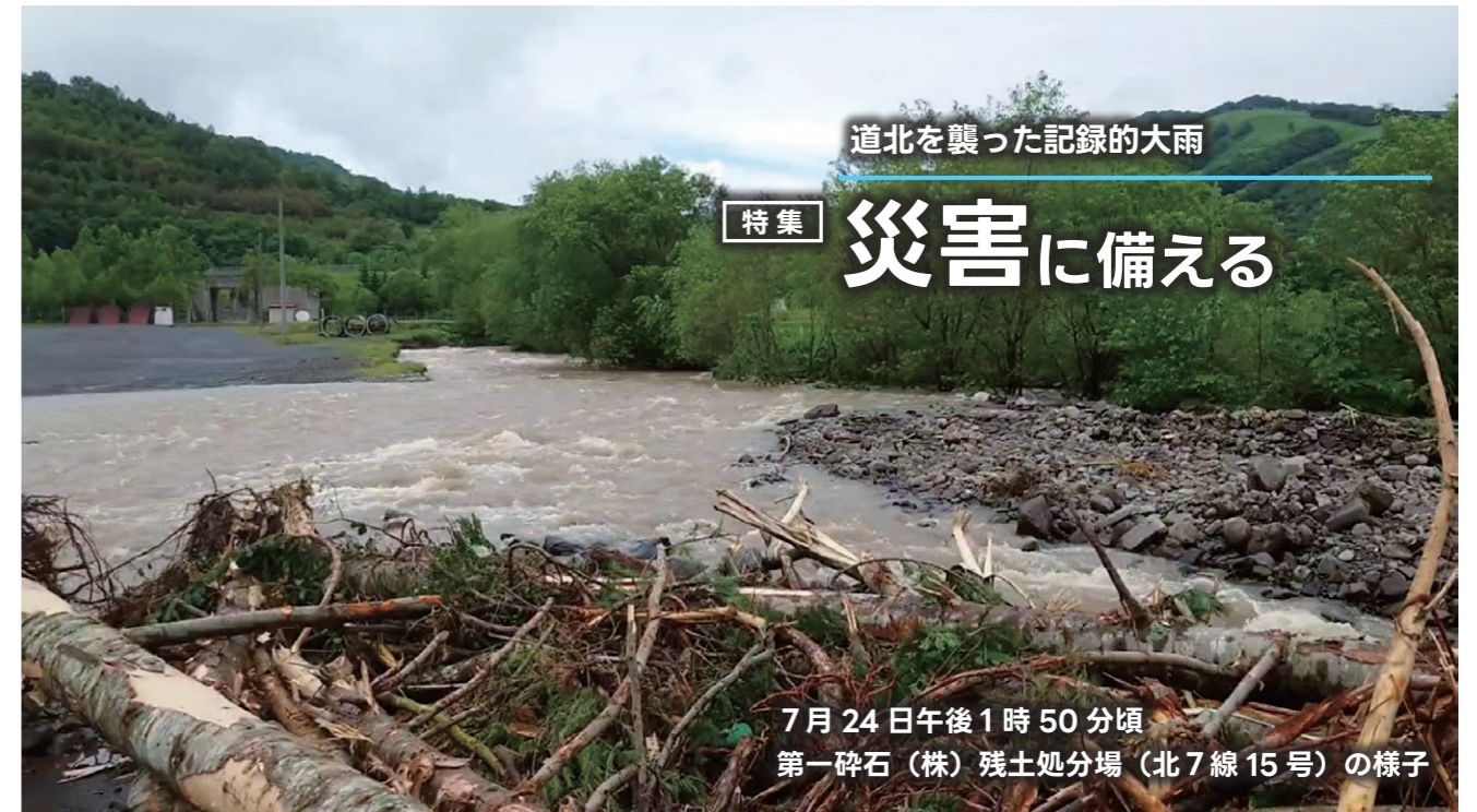
7月24日午後1時50分頃 第一碎石(株)残土処分場(北7線15号)の様子

旭川地方気象台が発表する警報・注意報などの情報もご確認ください。▶ P15「情報満載」参照