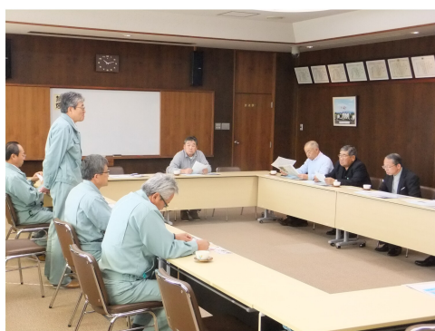
農業委員道外視察研修 (香川県七宝)

現在、全国で70%を超える玉ねぎの種子を出荷しています。更なる改良と規模の拡大を進めており、ひとつの縁から始まった本町での事業運営も今後の更なる発展が期待されることです。