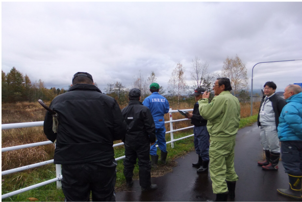
農地利用状況調査