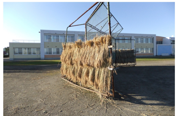
「ななつぼし」のはさかけ 中央小学校校庭

※平成26年12月～平成27年11月までに実際に締結された賃貸借契約を集計し算出したものです。