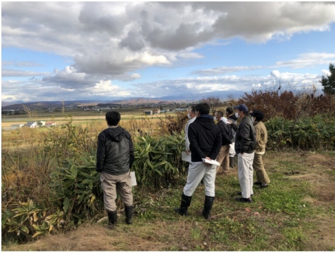
令和2年農地利用状況調査

令和2年10月27日、農業委員による調査を実施した結果、農地の荒廃化が一部に見られましたので、所有者は、周辺耕作者の営農条件に支障が生じないよう適切な管理をお願いします。 なお、農地の管理、貸借や売買などについてお困りの方は、農業委員会事務局へご相談下さい。