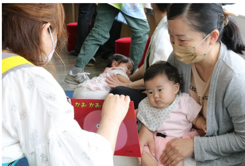
ブックスタート事業

比布町のすべての子どもがあらゆる機会とあらゆる場所において、自主的に読書活動を行うことができるよう、家庭・地域・学校等の連携を進め、積極的にその環境整備を図ります。