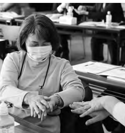
ピピカツリハビリ体操指導士養成講習会

【 保健福祉課長 】設計段階での建設位置などの対策に加えて、公園整備も同時に行うため、双方が良いものとなるよう調整していきたいと思えます。