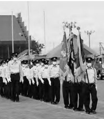
比布消防団夏期演習