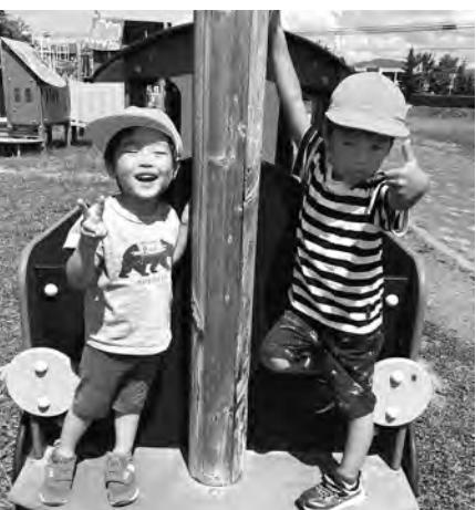
中央ふれあい広場

です。あそか苑にとっても初めてのことで、法人と連携して次回以降の採用を検討します。