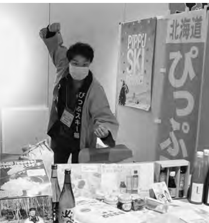
ふるさと応援フェスタ inチカホ