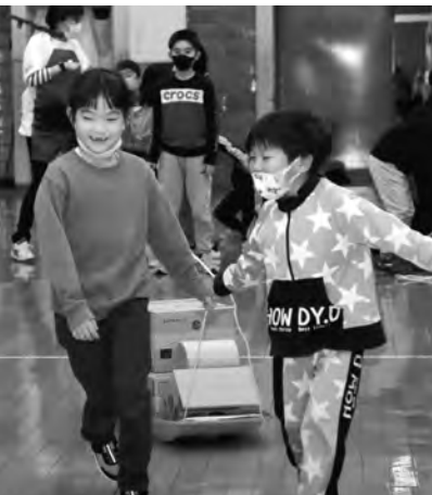
放課後児童クラブ・クリスマス会