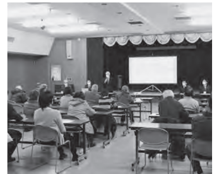
くるみ保育園新園舎建設 住民説明会