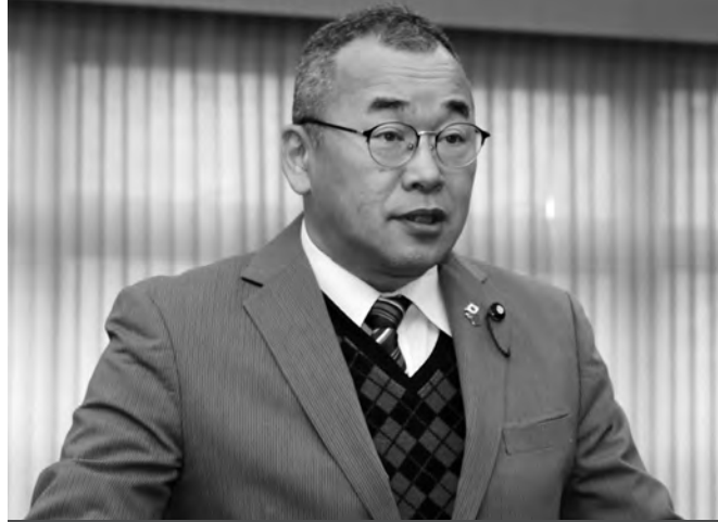
植西 浩一 議員

□質問・植西議員 優秀な生徒を育てるより、落ちこぼれをなくし、すべての子どもたちに希望を与えることを真に教育の目標とすべきではありませんか。