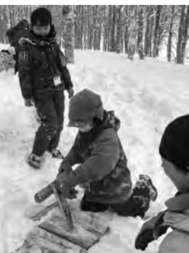
子ども体験教室 「比布アドベンチャーズ」

しかし、それを学校の中だけで行うには限界がありますので、そこで補っていくのが地域であると思えます。地域の中で子どもたちに様々な経験、体験をさせてあげることが将来、自分がどういう道に進みたいかということにつながっていくと考えています。