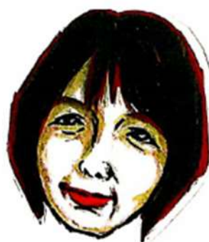
ケアマネ（介護福祉士）