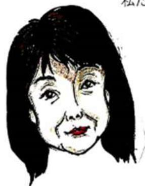
ケアマネ（介護福祉士）