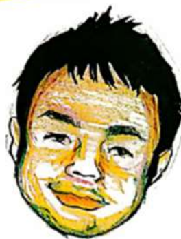
ケアマネ（介護福祉士）