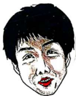
管理者（主任ケアマネ、社会福祉士、介護福祉士）

「福寿草」は居宅サービスの窓口として、介護支援専門員（ケアマネージャー）がご本人やご家族と相談しながら、在宅で安心した生活が出来るようにケアプラン（介護の計画）を立てます。事業所との連絡相談料は無料です。まずはご相談下さい。