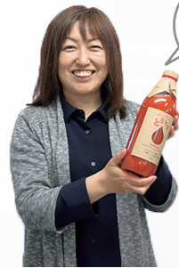
◀ 稲場農場 とろとろ (トマトジュース)