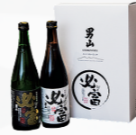
▲ JAびっぶ町 必富 (日本酒)