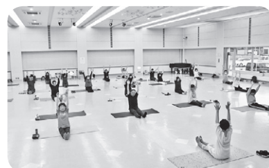
▲第1回「夜ヨガ」の様子

成人を対象として、生活習慣病の予防や運動するきっかけに「ピピカツフィットネス Lite」を実施しています。運動の専門家である地域おこし協力隊員が、簡単にできる運動を指導しますので、ぜひお気軽にご参加ください。問い合わせ先 保健センター