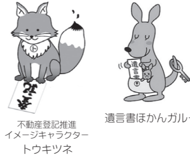
不動産登記推進イメージキャラクター トウキツネ