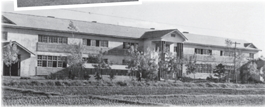
当時、全村民の念願でもあった比布中学校の建設。昭和25年度の在籍生徒数は606人、学級数は13クラスもありました。