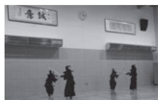
新校舎内に作られた武道場