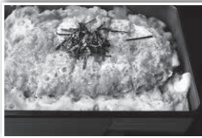
カツ重 800円 (一例です)