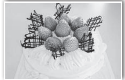
記念日には、ケーキはいかがでしょう