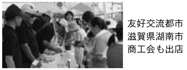
友好交流都市 滋賀県湖南市 商工会も出店