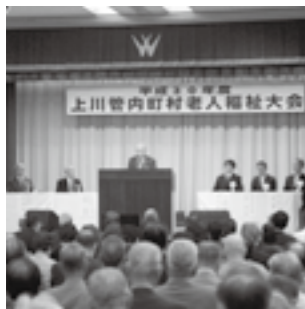
上川管内町村老人福祉大会