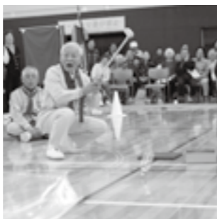
老人スポーツ大会

老人クラブでは、高齢者自らの生きがい高め、健康づくりを進める活動やボランティアをはじめとした各種活動を行っています。