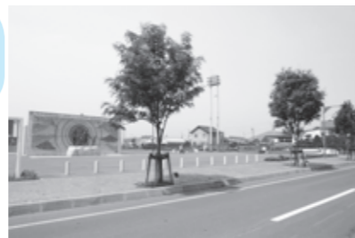
百年記念公園を紹介するリアル防災レッド